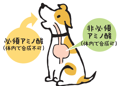
健康維持に重要な必須アミノ酸は、食べ物からの摂取しかないので!!

わかりづらいですね。要するに、『健康な体を保つために、必ず食べ物から摂らなければいけないモノ』なのです。